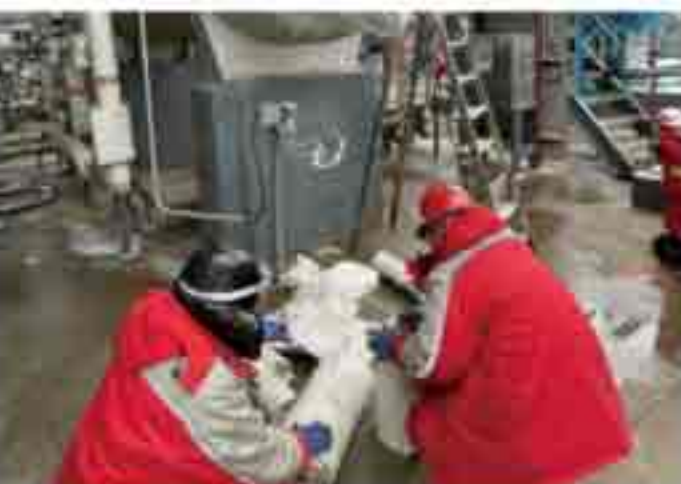
(图为生产运行中心员工对关键部位进行保温)

时发现问题并尽早解决，确保“不冻坏一台设备，一个阀门，一条管线”，全力保障冬季安全生产。